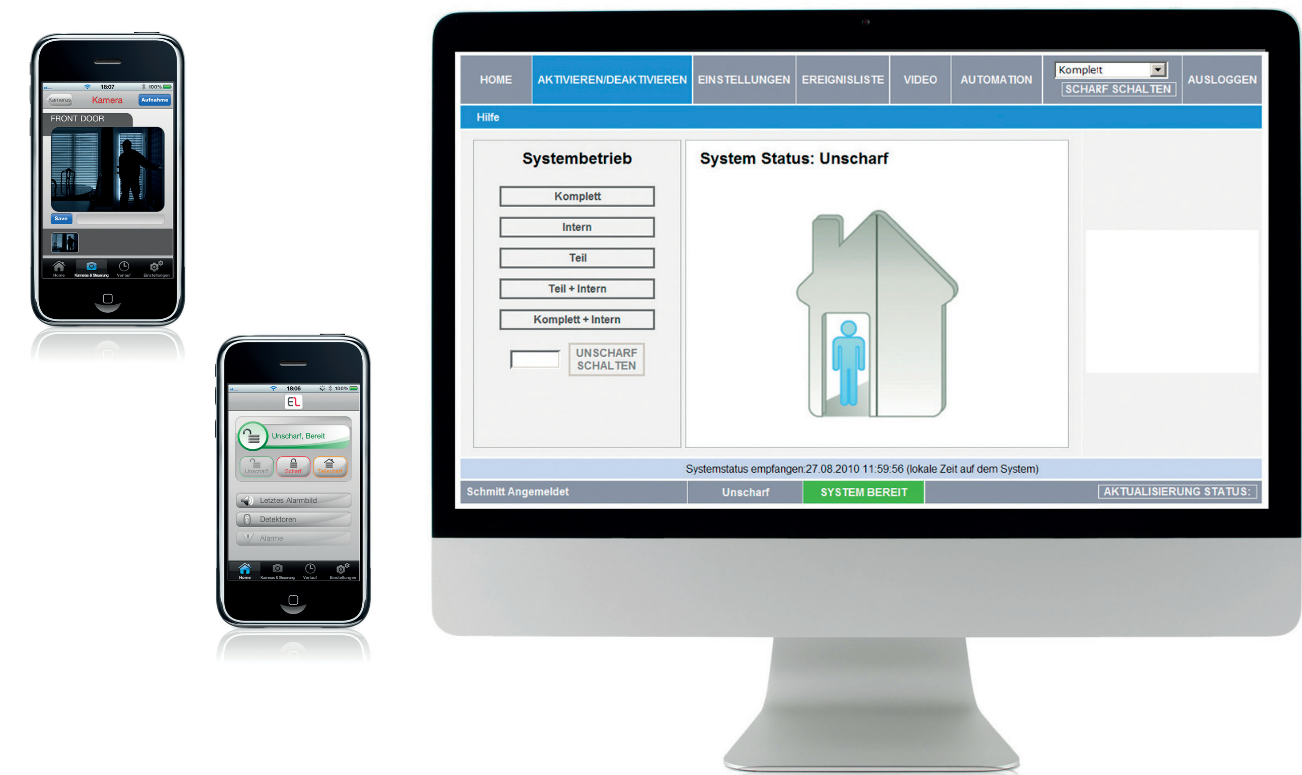
Web-User-Interface Benutzerbedienung via Internet und APP